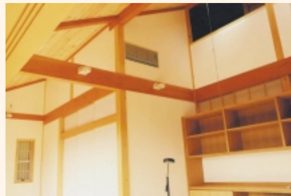
自然素材で囲まれた吹抜のある居間