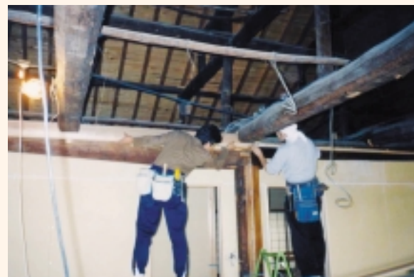
民家の改修工事の様子

引き続き住まいの疑問をお待ちしています。 e-mail: arbox@tokita.co.jp